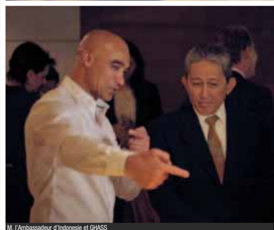
M. l'Ambassadeur d'Indonésie et GHASS